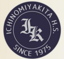
Original Button オリジナルボタン